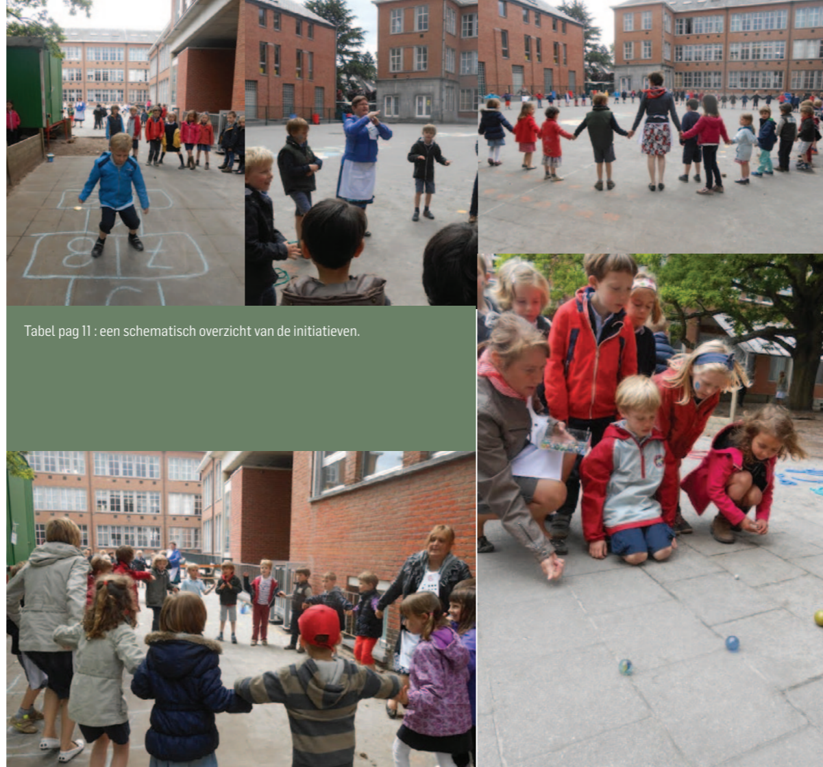
Tabel pag 11 : een schematisch overzicht van de initiatieven.

U begrijpt ondertussen wel het belang van een veilige overgang van de kleuterschool naar de lagere school. Centraal staan hierbij het welbevinden en het zelfvertrouwen van de kinderen. Om deze sfeer van geborgenheid te creëren, streven we naar een goede en transparante samenwerking tussen beide onderwijsniveaus.